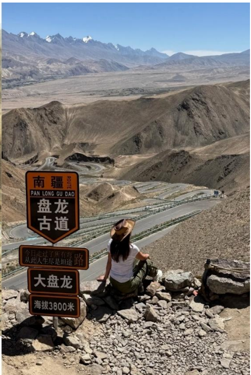
ถนนมังกรพันโค้ง/ผานหลง (Panlong Ancient Road)