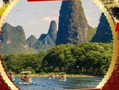
ล่องแพแม่น้ำหลีเจียง