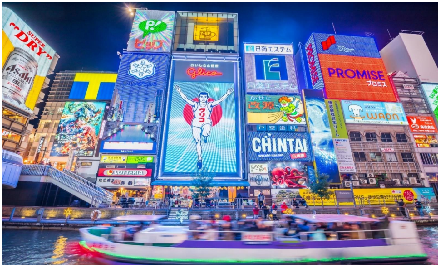
คำ อีระอาหารตามอัยาศัยเพื่อสะดวกแกการช้อปั้ง ที่พัค SUN WHITE HOTEL, OSAKA หรือเทียบเท่า