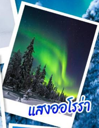
แสงออโรรา