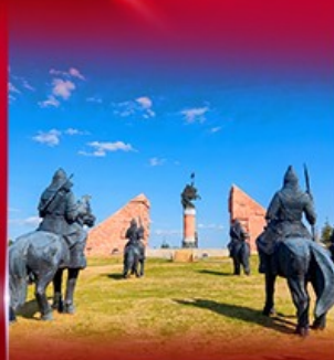
สวนสาธารณะงกิล่า