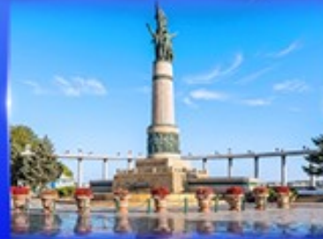
อนุสาวรีย์นิ่มพ