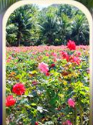
ทุ่งอ่าวย่าหลง