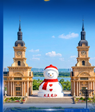
ตุ๊กตาหิมะยักษ์ ฮาร์บิน