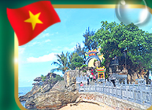
สักการะขอพรศาลเจ้ามังกร