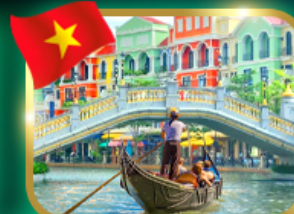
เวนิสจำลอง แกรนด์ เวลด์