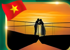
ชมอาทิตย์ตก ณ สะพานจู