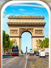
ARC DE TRIOMPHE FRANCE