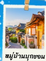
หมู่บ้านนุกซอน