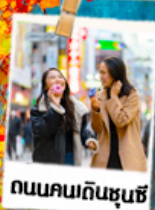
ถนนคนเดินชุนชู่