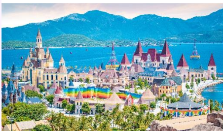
VinWonders NHA TRANG