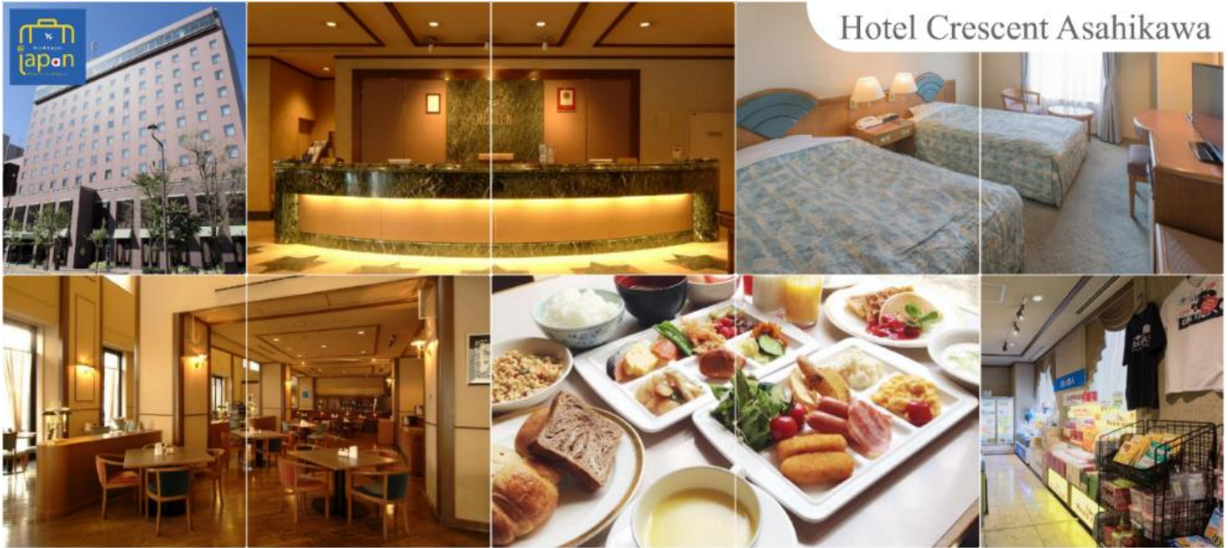
Hotel Crescent Asahikawa

รับประทานอาหารเย็น ณ ภัตตาคาร (6) HOTEL CRESCENT ASAHIKAWA หรือเทียบเท่าระดับเดียวกัน