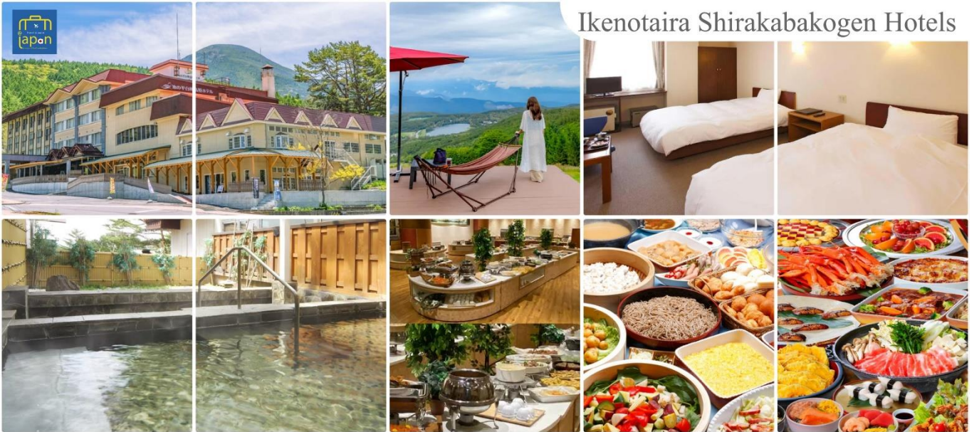
Ikenotaira Shirakabakogen Hotels

หลังอาหารให้ท่านได้ผ่อนคลายกับการแช่น้ำแร่ธรรมชาติ เชื่อว่าถ้าได้แช่น้ำแร่แล้ว จะทำให้ ผิวพรรณสวยงามและช่วยให้ระบบหมุนเวียนโลหิตดีขึ้น