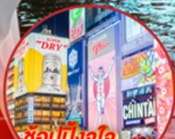
ช้อปปิ้งใจ..... Shinsalbashi

โอโห้!! ชมใบไม้เปลี่ยนสีที่สวยงามที่สุดในภูมิภาค ณ หมู่เขาโคริงเค อสังการไฟลันดวณ ณ หมู่บ้านนาบะโนะ โนะ ซาโตะ ชม หมู่บ้านมรดกโลกการ์นตีโดย UNESCO ณ หมู่บ้านชิราคาว่าโตะ ปราสาทมัตสึโมโตะ เป็น 1 ใน 12 ปราสาทดั้งเดิมที่ยังคงสมบูรณ์และสวยงาม ชมสวนสไตล์ญี่ปุ่น และเยือน วัดกินคะคุจิ หรือ วัดเงิน แห่งเมืองเกียวโต