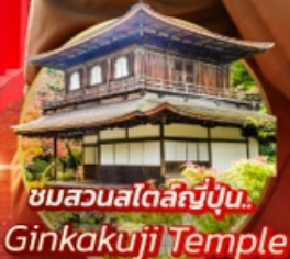
ชมสวนสโตนี่ญี่ปุ่น... Ginkakuji Temple