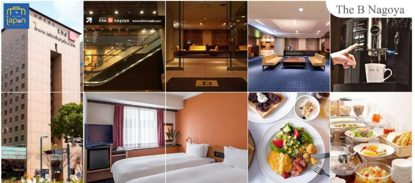
The B Nagoya

รับประทานอาหารเย็น ณ ภัตตาคาร (5) THE B NAGOYA หรือเทียบเท่าระดับเดียวกัน