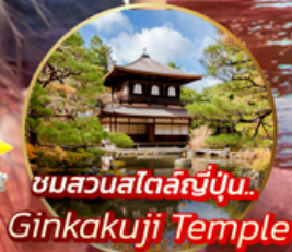
ชมสวนสไตล์ญี่ปุ่น.. Ginkakuji Temple