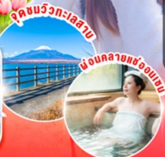
จุดชมวิวกะเลสาบ