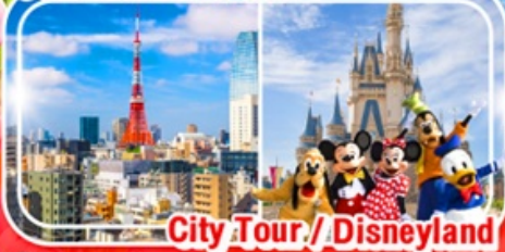
City Tour / Disneyland