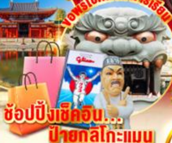
ช้อปปิ้งเชคอิน... ป้ายกุสึโกะแมน