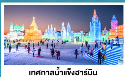
เทศกาลน้ำแข็งฮาร์บิน