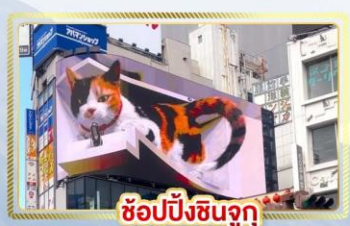
ซูปป์ชินจูกุ