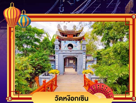
วัดหังอกซิ่น