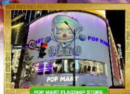
POP MART FLAGSHIP STORE