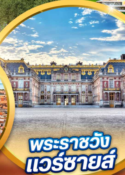
พระราชวัง แวร์ซายส์