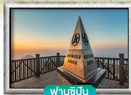
ฟานชีปัน