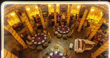
ทานอาหารสุดหรู ภัตตาคาร Turandot