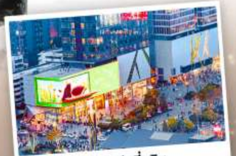
ถนนไท่กู๋หลี่หลิน