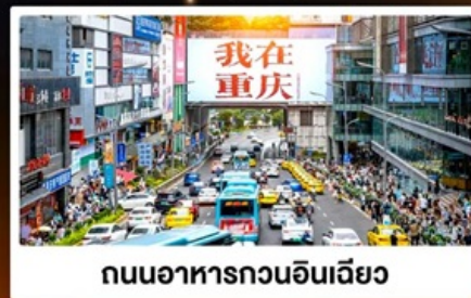
ถนนอาหารถวอินเดียว