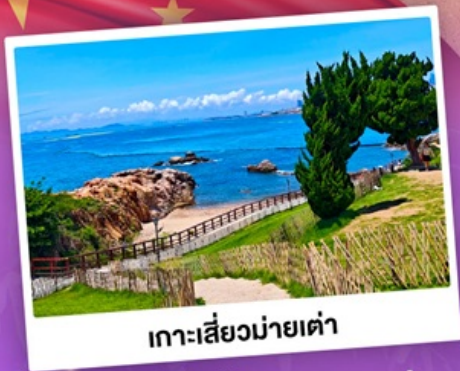
เกาะเสี่ยวมายเต่า

เที่ยวชิงเต่า เมืองทะเลสุดชิล ครบทั้งกิน เที่ยว ถ่ายรูป