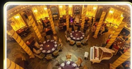
ทานอาหารสุดหรู ภัตตาคาร Turandot