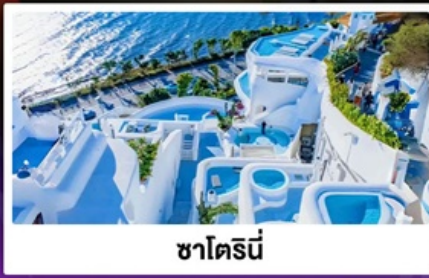
ซาไดร์นี่