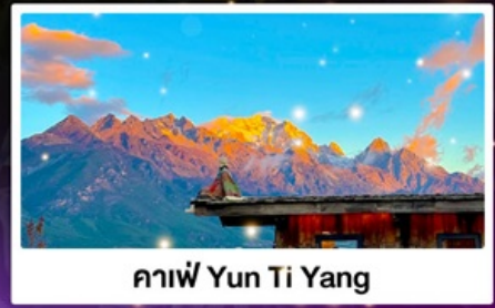
กาแฟ Yun Ti Yang