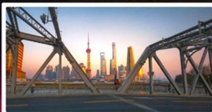
สะพานไวปี้ตู่