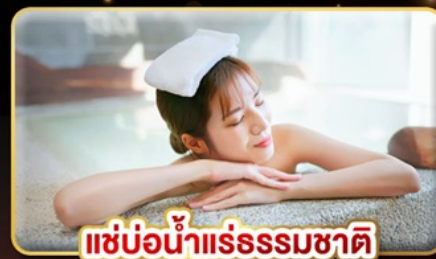
แช่น้ำแร่ธรรมชาติ