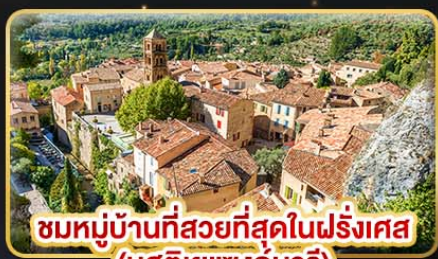
ชมหมู่บ้านที่สวยงามที่สุดในฝรั่งเศส (มุสตีเยแซงท์มารี)