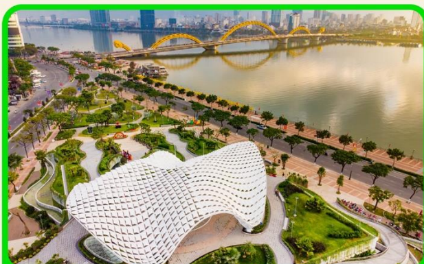
เช็คอิน แหล่งที่เที่ยงใหม่ APEC PARK