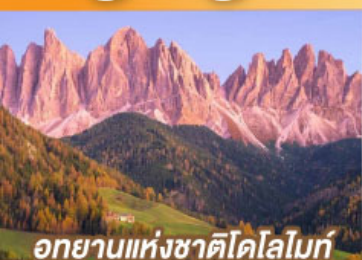
อุทยานแห่งชาติโดโลไมท์