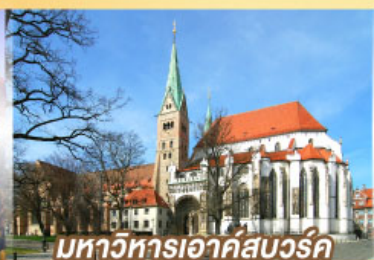
มหาวิหารเอาค์สเวิร์ค