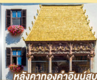
หลังคาทองคำอินน์สบูร์ค