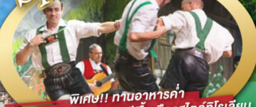
พิเศษ!! ทานอาหารค่ำ พร้อมชมการแสดงดนตรีพื้นเมืองสไตส์โรเลียน และเยือนเมืองอูเทรคต์ สีสันใหม่เนเธอร์แลนด์

ไฮไลท์โปรแกรม • เยือนเมืองแห่งแคว้นบาวาเรีย และ ทิโรล • สุกสนานเหมืองเกลือเบิร์ชเทสกาเดิน • เข้าชมปราสาทนอยชวานสไตน์ • เดินเล่นจัตุรัสโรเมอร์ ซอปปิง Zeil Street • ถ่ายรูปมุมสวยของหมู่บ้านอัลสติก • ซิลลา ไปในเมืองซาลสบูร์ก บ้านเกิดโมสาร์ท • ล่องเรือหมู่บ้านทีธูร์น และ ล่องเรือชมนครอัมสเตอร์ดัม • ซอปปิงจุใจย่านดิมสแควร์และเดินเล่นย่านโคมแดง 25 ก.ย. - 04 ต.ค. 69 09-18, 16-25 ต.ค. 69 22-31 ต.ค. 69 / 06-15 พ.ย. 69 29 ธ.ค. 69 - 07 ม.ค. 70 * ปีใหม่ *