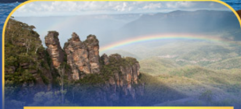
อุทยานแห่งชาติบลูเมาท์เทนส์ Three Sister Rock