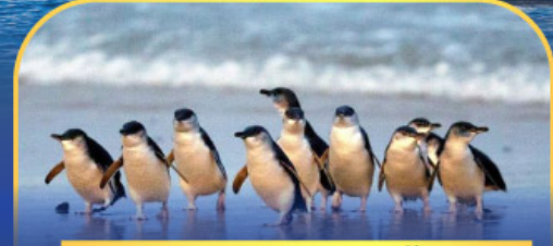
พาหระดนกเพนกวิน