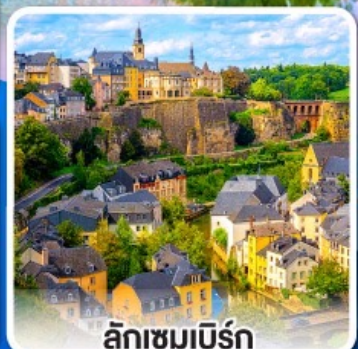
ลักเซมเบิร์ก

ล่องเรือ... ชมทัศนียภาพอันสวยงาม ตลอดสองฟากฝั่งของแม่น้ำไรน์