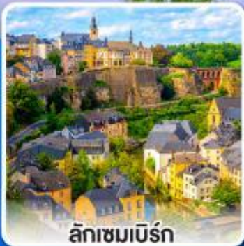
ลักเซมเบิร์ก