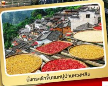
นั่งกระเช้าขึ้นชมหมู่บ้านหวงหลิง