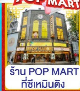
ร้าน POP MART ที่ซีเหมินติง