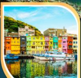
ท่าเรือเจิ้งปิ่น