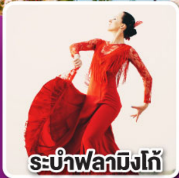
ระบำฟลามิงโก

ล่องเรือชมความน่ารัก ตามธรรมชาติของฝูงโลมา