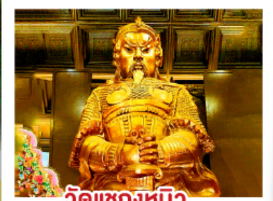
วัดแขกหมิว