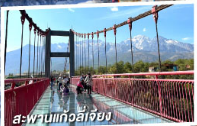
สะพานแก้วลี่เจียง