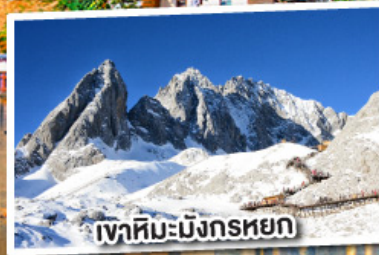
เขาสหิมะมังกรหยก