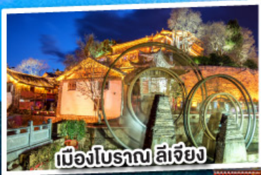
เมืองโบราณ ลี่เจียง