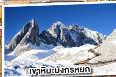
เขาสหิมะมังกรหยก