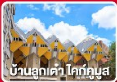
บ้านลูกเต่า โคก์กูมูส