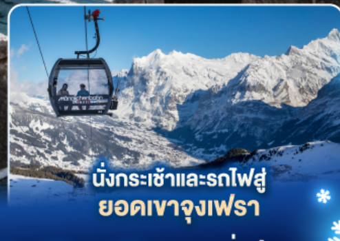
นั่งกระเช้าและรถไฟสู่ ยอดเขาจุงเฟรา