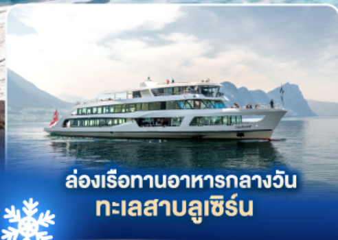
ล่องเรือทานอาหารกลางวัน ทะเลสาบลูซิิร์น